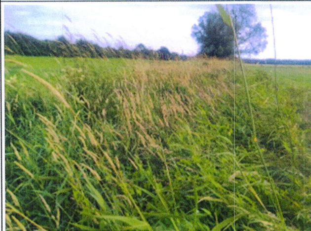
Photo n°3 : vue intermédiaire des travaux du ruisseau de Francoquetôt