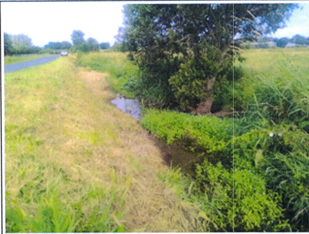
Photo n°1 : vue de la limite aval des travaux du ruisseau de Francoquetôt

(NB : l'emplacement des prises de de vue est indiqué sur la carte n°3)