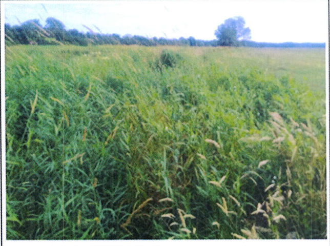
Photo n°2 : vue intermédiaire des travaux du ruisseau de Francoquetôt